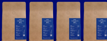
gratis Café Aromis Giftset